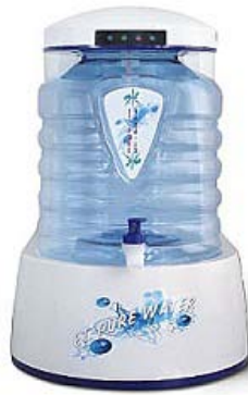
卓上型逆浸透膜（RO）浄水器E T ピュア