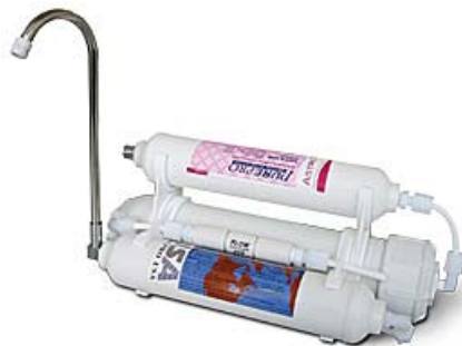
ポータブル逆浸透膜（RO）浄水器RO202