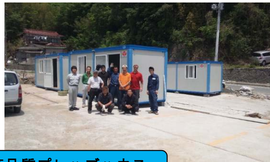
イタリア製高品質プレハブハウス