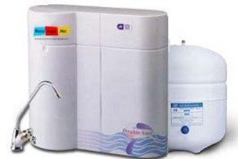
コンパクト逆浸透膜（RO）浄水器ダブルスター