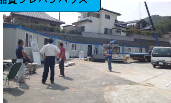
オーストラリア製高級コンテナハウス