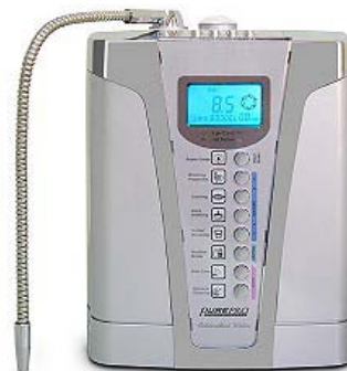
アルカリイオン整水器 JA703