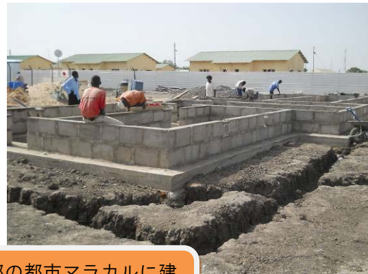
南スーダン北部の都市マラカルに建設した国際機関向け宿営地