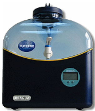
卓上型逆浸透膜（RO）浄水器アストロボーイ